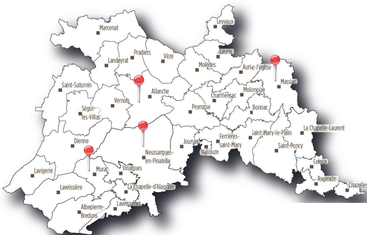
Carte du territoire de Hautes Terres Communauté

Le TAD (Transport À la Demande) peut vous aider à accéder aux Maisons France Services !