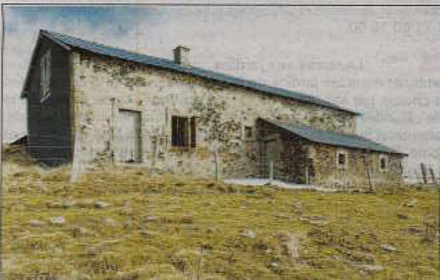
Le buron du Caire à Vèze