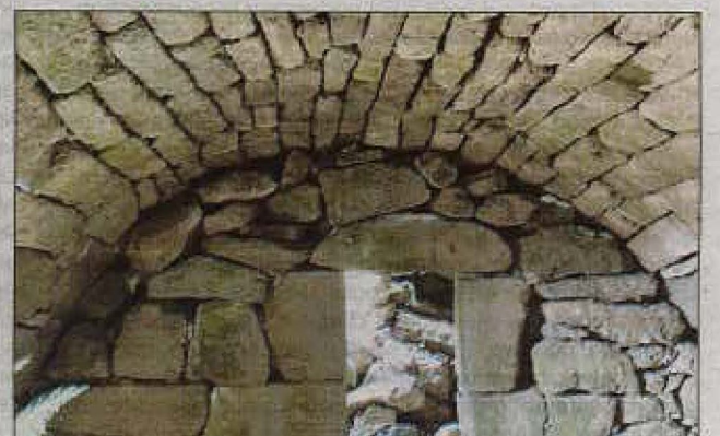
La belle cave voûtée du buron du Peyre-Arse à Lavigerie