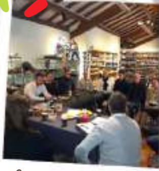
Café des Commerces